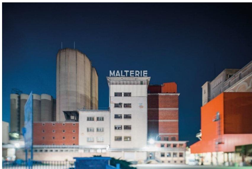
Une illumination inédite rendue possible par le Groupe Soufflet et SMA - Bartosch

Le suivi technique a été confié à l'entreprise Berest , groupe d'ingénierie spécialisé en Infrastructures notamment en urbanisme et paysage, concepteur des aménagements de la rue du Port du Rhin financés par le Port de Strasbourg.